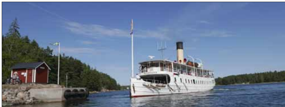
Vid Alsviks brygga på Blidösunds dag den 3 augusti 2019.