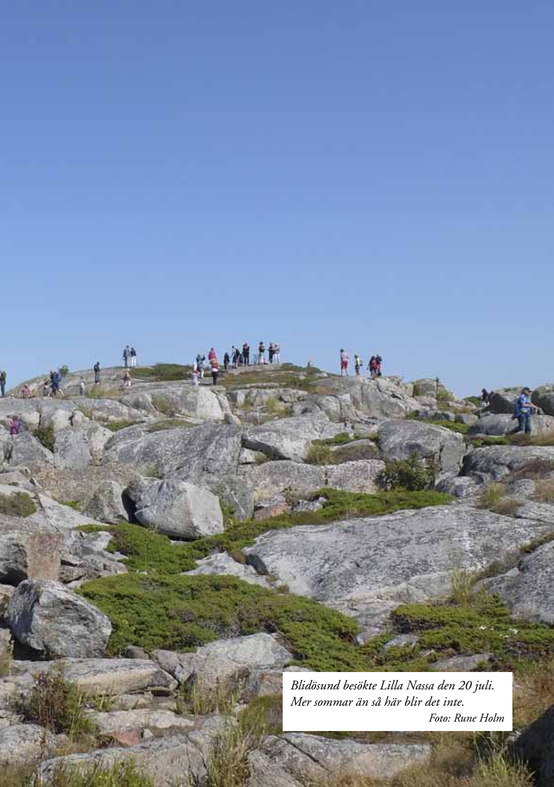
Blidösund besökte Lilla Nassa den 20 juli. Mer sommar än så här blir det inte.